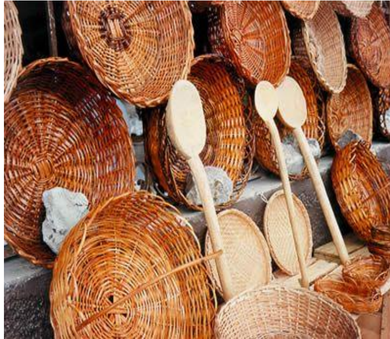
CESTOS DE PALHA